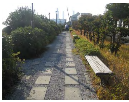
海芝浦駅直結の公園前も京浜運河