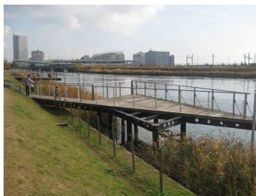
帷子（カタビラ）川河口部の人口葦原と川に突き出たデッキ