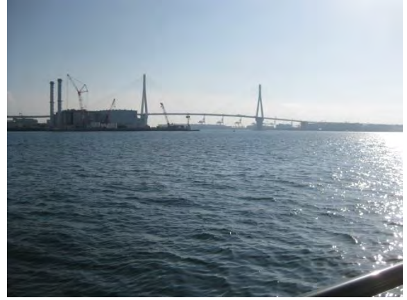
海芝浦駅のホームから鶴見翼橋を望む