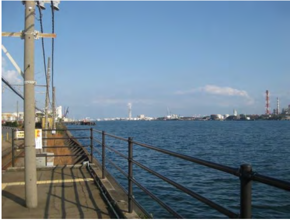
海芝浦駅のホーム横は京浜運河