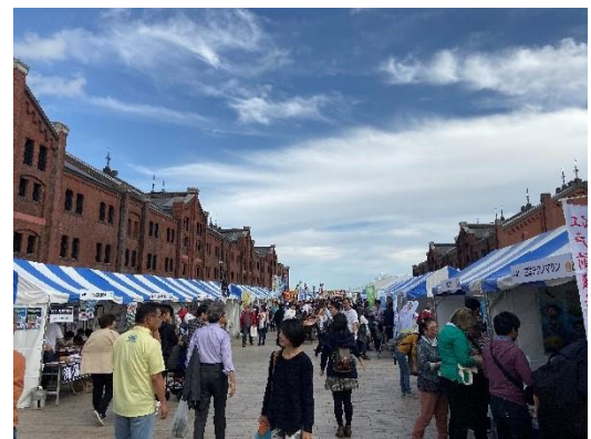
赤レンガ倉庫広場会場