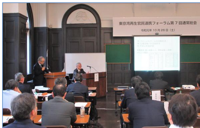
令和元年度通常総会の開催受付・横浜市開港記念会館