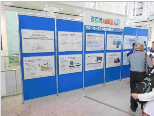
「ブルーカーボンの取り扱い PR コーナー」