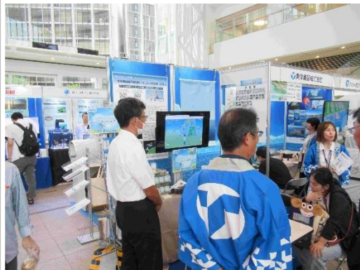
出展例・ 東洋建設㈱のブース