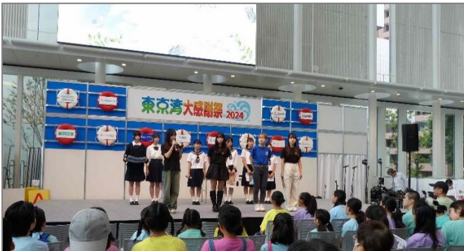
「あしたも青い地球で会いたい」