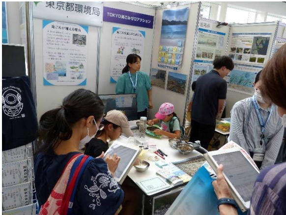
出展例・りんかい日産建設(株)による折り紙コーナー