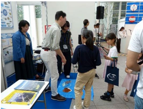
出展例・横浜市の展示