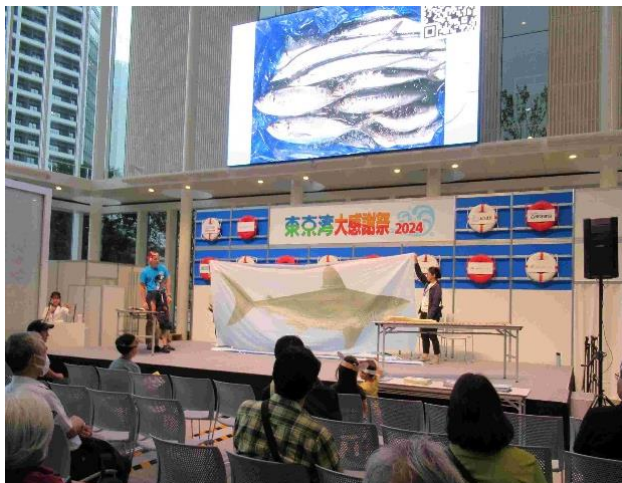
「江戸前ってすごい！海の巨大モンスター！」 江戸前 PT・大日本水産会・早武さんによる紹介