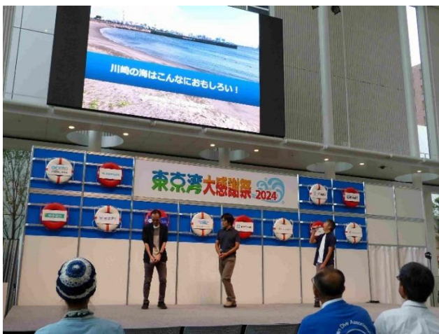
「東京湾地元自慢～マイフィールドホームタウン」の中の