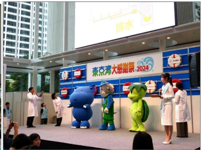
「水の天使と考えよう」東京 WONDER 下水道