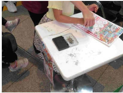
スタンプラリーの様子・会場訪問・スタンプ押印・景品抽選