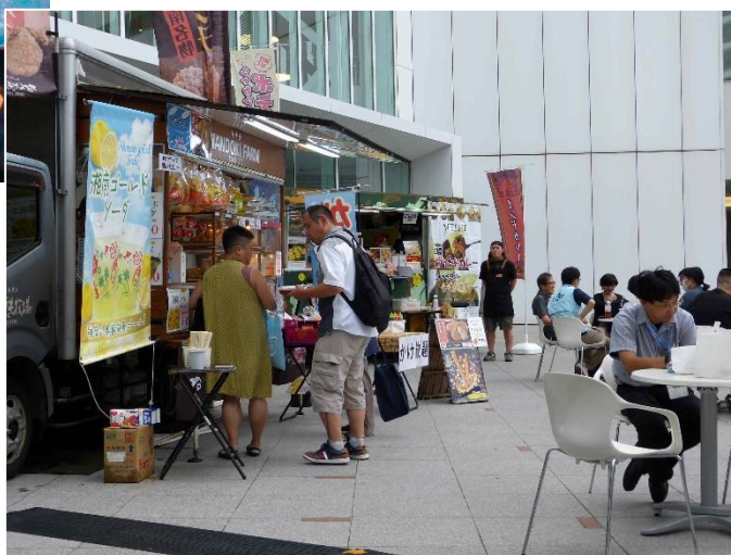
アトリウム外側でのキッチンカーによるアジフライの提供