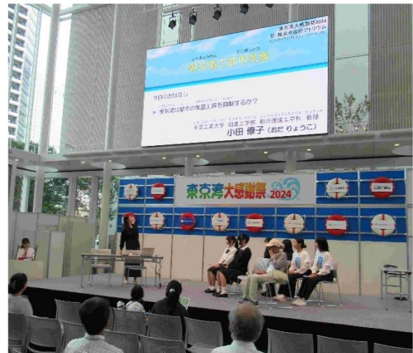
「東京湾と都市気象」 小田教授による クイズ形式によるコミュニケーション講演