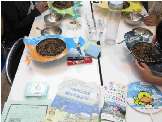
出展例・東京都環境局によるプラごみ探し体験