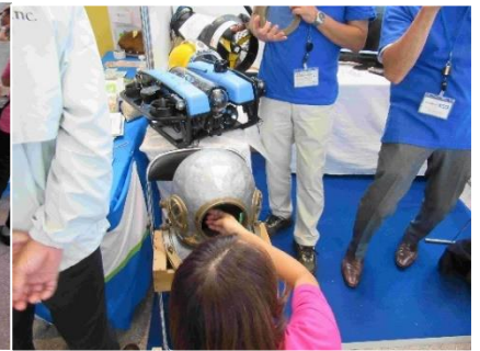
出展例・日本潜水協会の潜水具展示