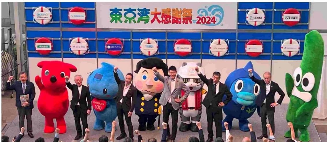
東京湾大感謝祭 2024 開会のセレモニー