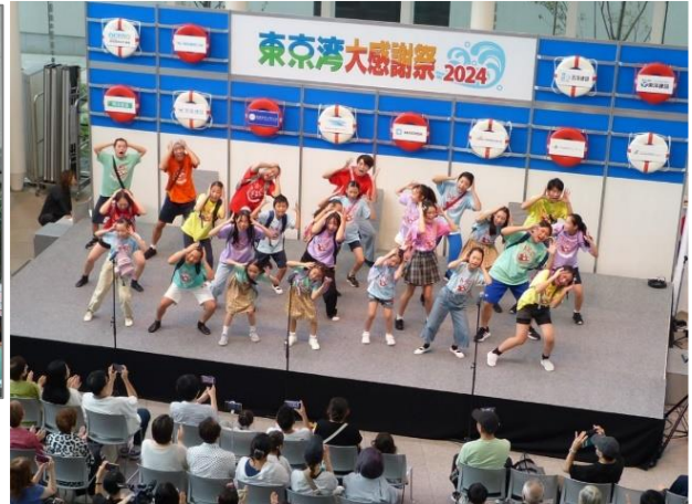
「ワタシノユメ」 横浜市民子どもミュージカル