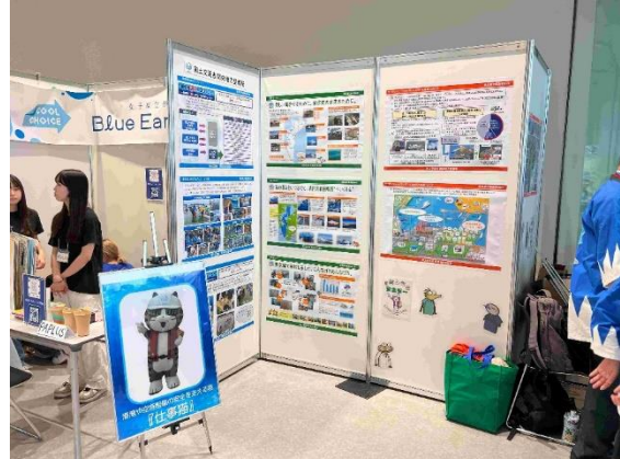
出展例・関東地方整備局の展示