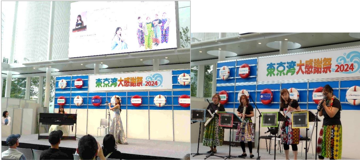
「黒船楽団」による演奏