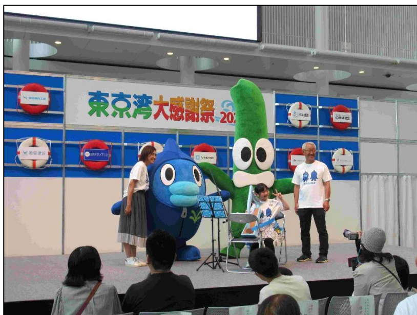
「うみスケと学ぶ！ブルーカーボン」デジタル絵本の読み聞かせ