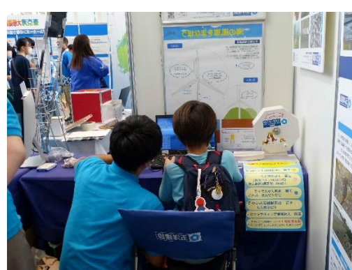
出展例・五洋建設(株)の展示