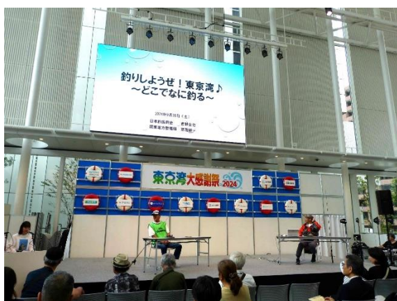
東京湾での釣りステージ 「釣りしようぜ！東京湾♪どこでなに釣る？」