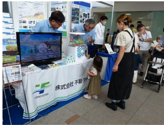
出展例・(株)不動テトラのブース