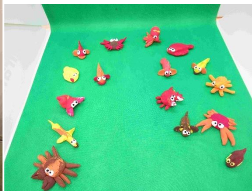
モニタリング推進 PT によるハゼ、カニの粘土細工の工作体験