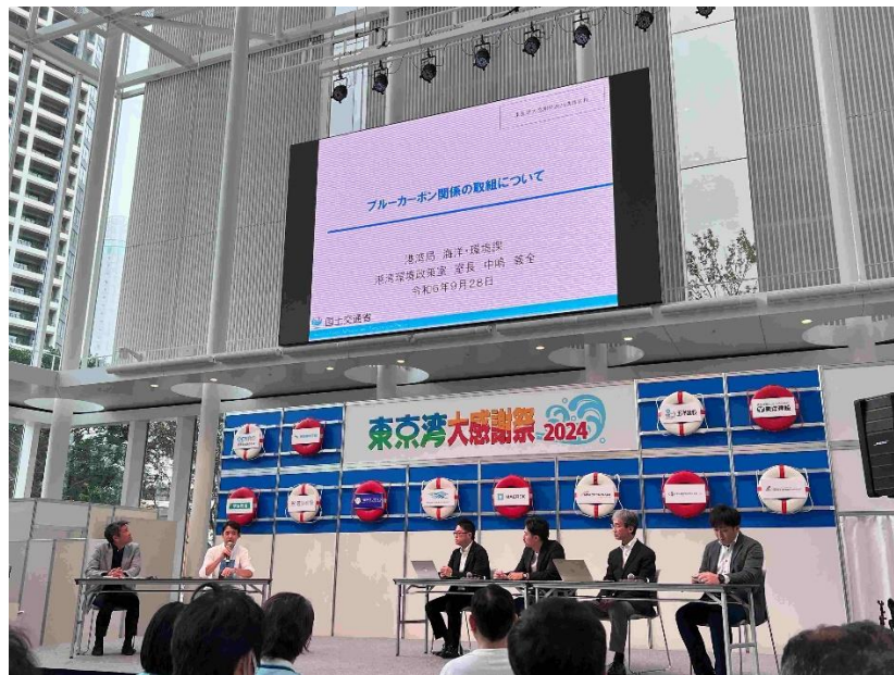
「購入者とともに学ぶ」ブルークレジット