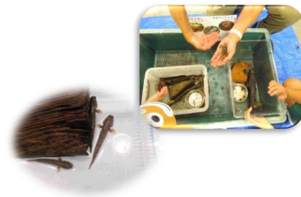
東京湾の窓 PT によるカニ、トビハゼとのふれあい体験