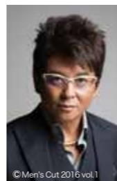
© Men's Cut 2016 vol.1